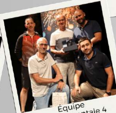
Équipe départementale 4 ESO Tennis de table