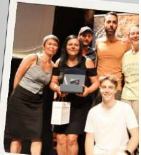
Equipe ESO 4 ESO Volley