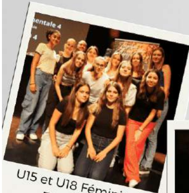
U15 et U18 Féminines ESO Basket